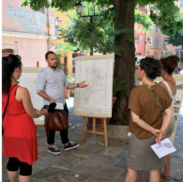
> Déambulations dans le centre ancien de Grasse