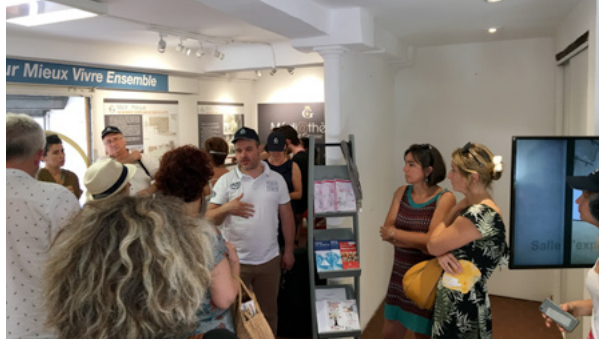
> Discussions entre praticiens

La question de la formation ne peut être pensée de manière isolée : elle s'inscrit dans un projet plus large qui, outre Grasse Campus Academy (enseignement supérieur et recherche), comprend deux autres volets : Grasse Campus Life et Grasse Campus Housing. Ces trois axes sont interdépendants les uns des autres, et car le développement de formations dans l'enseignement supérieur et la recherche nécessite de penser l'accueil des étudiants, à travers une offre de services et de logement adaptée.